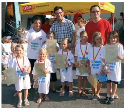
Vor großem Publikum erhielten die kleinen „Tennisstars“ ihre Medaillen und Urkunden.