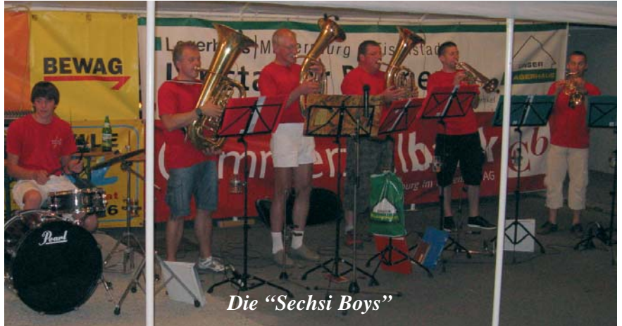
Die "Sechsi Boys"

An einem der schönsten Wochenenden dieses Sommers fand das Musikerfest vor dem "Haus der Musik" statt. Den musikalischen Auftakt am Samstag machten die "Sechsi Boys". Danach ging es weiter mit Unterhaltungsmusik von DJ Robby. Für die zahlreichen Gäste aus Marz und der Umgebung spielten am Sonntag zum Frühschoppen die Wulkatalmusikanten auf und sorgten